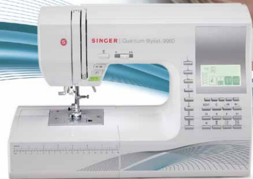
Quantum Stylist™ 9960